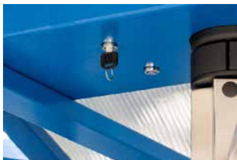
Sblocco manuale del tornello