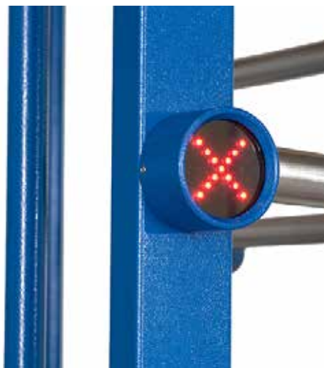
Indicazione di accesso negato