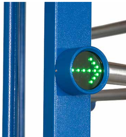
Segnaletica per indicare la direzione d'apertura

Lo sblocco del tornello in ingresso o uscita avviene tramite contatti puliti, il che per cui garantisce una facile integrazione con i sistemi di controllo accessi. E' possibile impostarlo, in base alle necessità: controllato in modalità bidirezionale o bloccato in un verso. La segnaletica rende l'utilizzo del tornello intuitivo - viene indicata la direzione d'apertura oppure informazione di negato accesso.