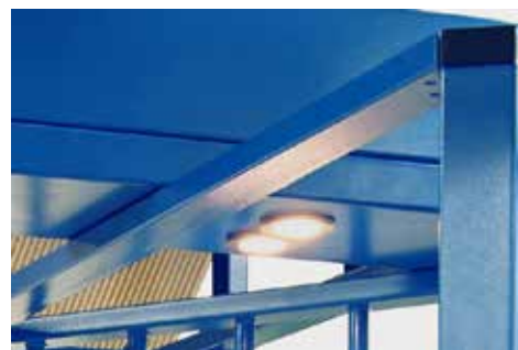
Illuminazione dei passaggi