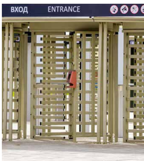
Il tornello può essere integrato con i lettori di controllo accessi