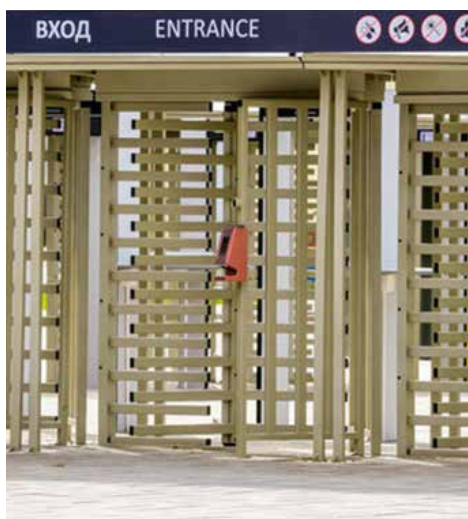
Il tornello può essere integrato con i lettori di controllo accessi