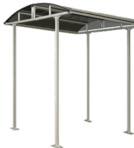
Tettoia protettiva opzionale