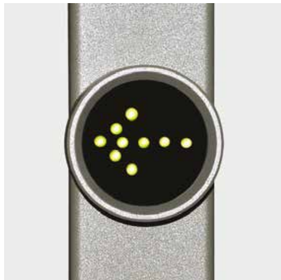
Segnaletica per indicare la direzione d'apertura

Lo sblocco del tornello in ingresso o uscita avviene tramite contatti puliti, il che per cui garantisce una facile integrazione con i sistemi di controllo accessi. E' possibile impostarlo, in base alle necessità: controllato in modalità bidirezionale o bloccato in un verso. La segnaletica rende l'utilizzo del tornello intuitivo - viene indicata la direzione d'apertura oppure informazione di negato accesso.