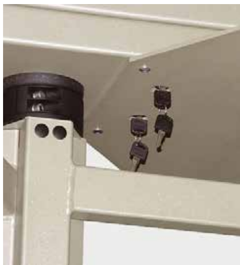
Sblocco manuale del tornello